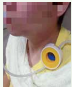
鼻胃管收納固定器 夾於衣領