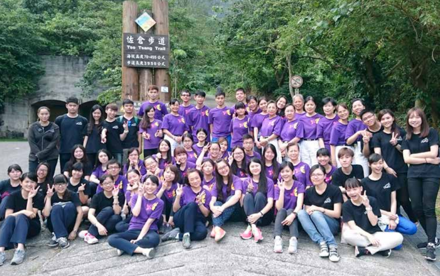
慈濟大學護理學系 101 級師生與懿德媽媽同遊佐倉步道，留下難得的團體合照。