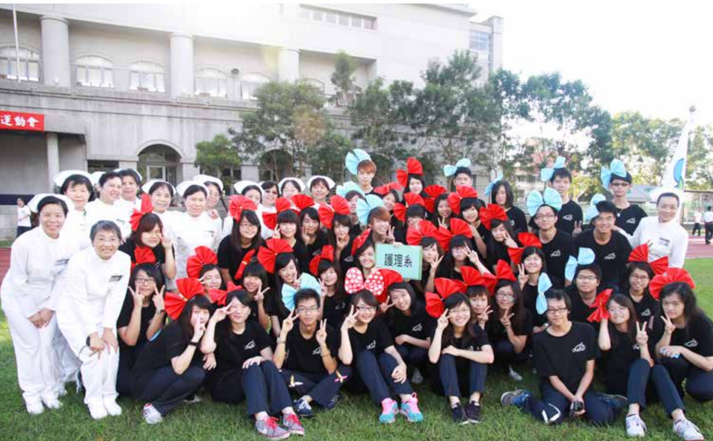
感恩懿德爸媽的四年的陪伴，同學們轉眼就要畢業了。圖為同學們大一時參加運動會時的模樣。

老師說今天同學們全員到齊，一個都不漏，班級的向心凝聚力可見一斑，三年多以來老師們的用心教學得到印證，也肯定孩子們的成長，真的是一分耕耘，一分收穫。