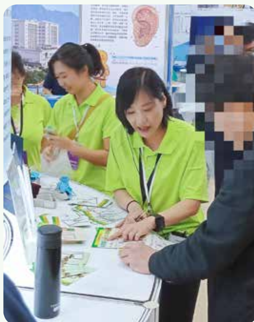
花蓮慈院傷口造口護理團隊與呼吸照護中心團隊獲護師公會聯合會創新競賽佳作。圖攝於南港醫療科技展場。