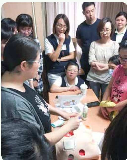
花蓮慈院內以 IAD012 照護模組進行照護教學。

(二) 紅綠燈：以紅綠燈概念呈現 3 個損傷等級，即 0 至 2 級，同時代表不同等級 IAD 照護組合包。