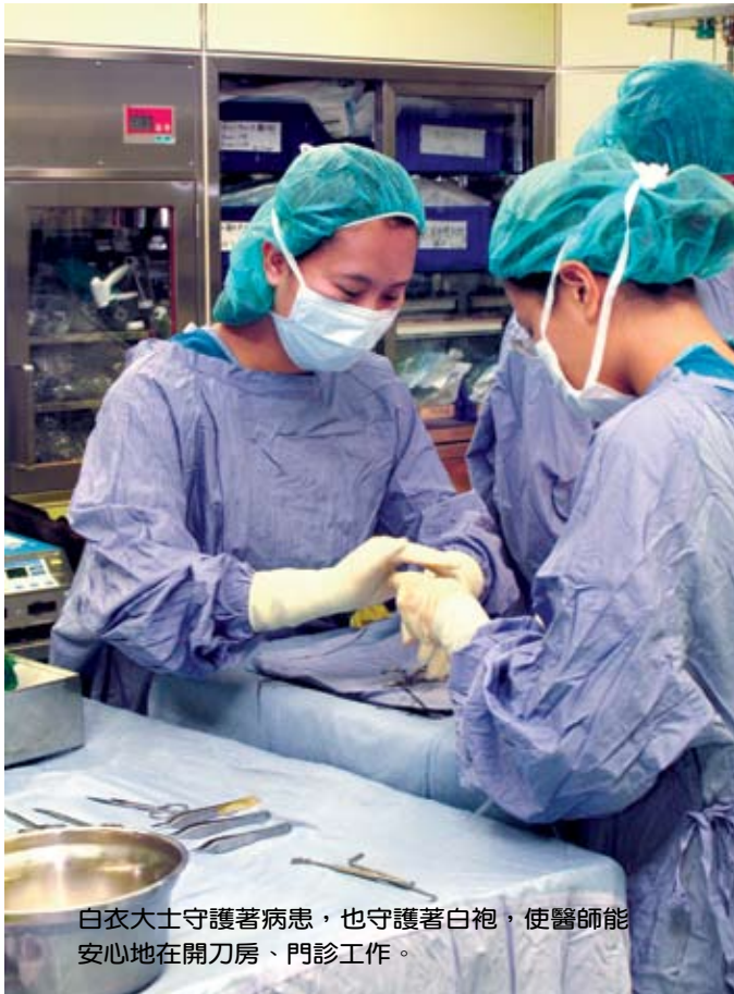
白衣大士守護著病患，也守護著白袍，使醫師能安心地在開刀房、門診工作。