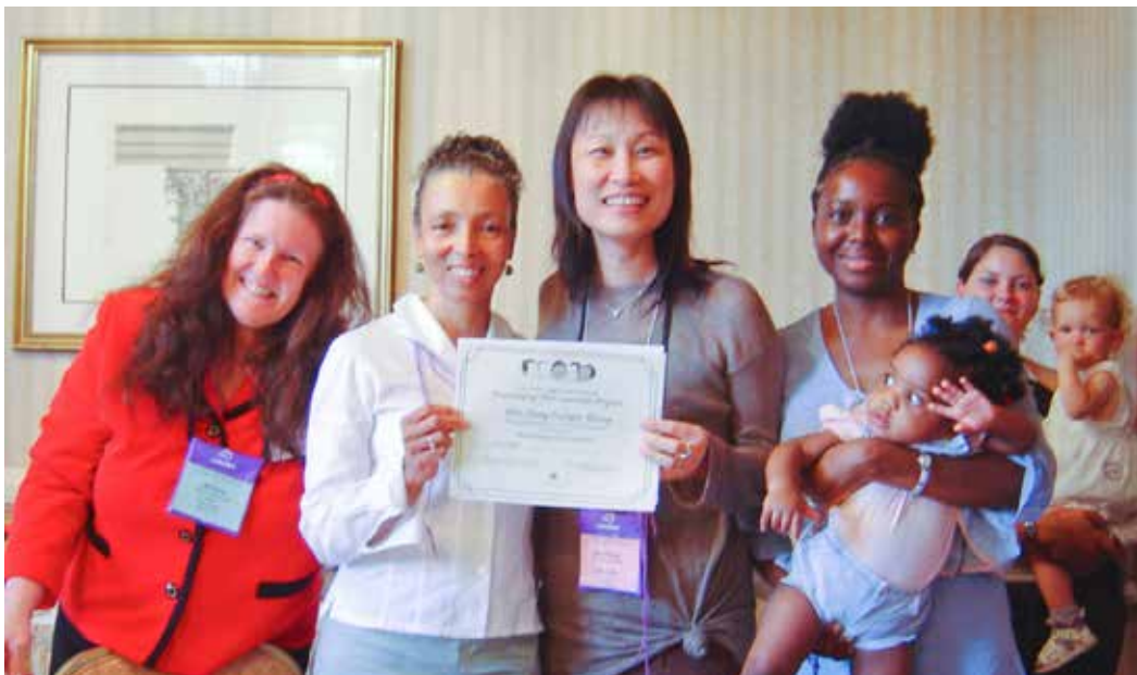
2005年參加 LLLI 國際母乳會在美國華盛頓特區辦理第 49 屆大會，同時取得同儕諮詢員證書時與帶領人合影。

因為護理，了解「給你」的真義 身為女性，體驗「生育／哺育」之能量 成為泌乳顧問，確認「陪伴膚慰」的豐沛與蘊藏 因為投身與行動實踐……所以遇見生命的美好