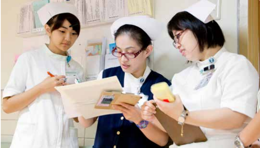
若能找到開啓自己內在的鑰匙，則生活或工作都將能量不滅。

的確，有些疑問，經過時間的淬煉，越資深時，答案就浮現；但也有很多疑問，即使回答了學弟妹，也必須坦白，自己也還在尋找答案。綜合這樣的結果，讓我去想：「到底如何做，才能保有護理的初心？以及維持自我及工作的平衡點？」期望能提供給同仁一把開啓自己內在的鑰匙，但要正確表達讓大家明瞭，卻是很不容易。