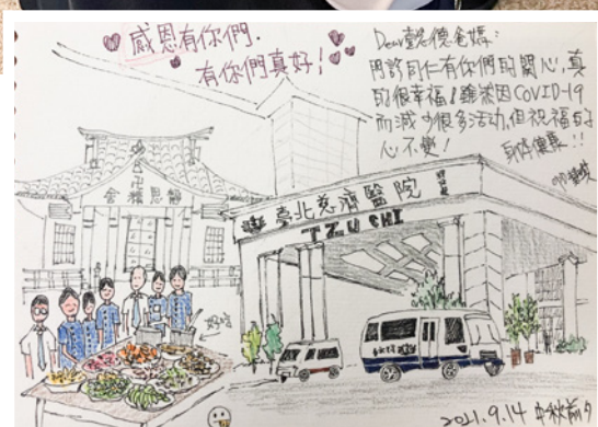
將護理同仁親手繪製的卡片送給懿德爸媽；向爸媽道謝。