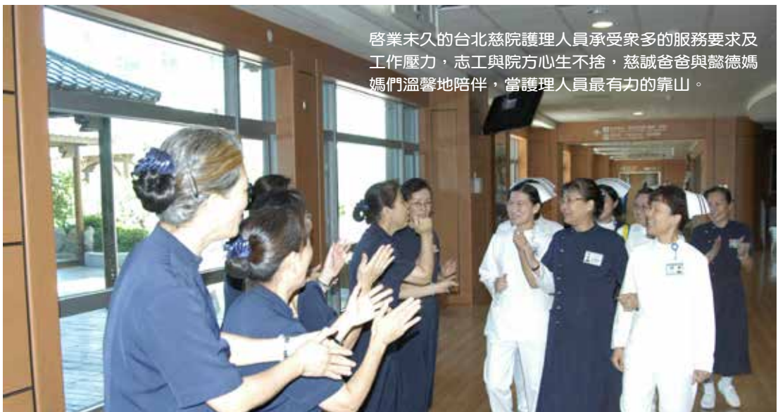
啓業未久的台北慈院護理人員承受眾多的服務要求及工作壓力，志工與院方心不生捨，慈誠爸爸與懿德媽媽們溫馨地陪伴，當護理人員最有力的靠山。