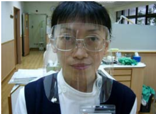
環保防護面罩，每個20元。

經過三年的時間，黃銘傑醫師仍不斷的創新，最新一代的防護罩更為簡便，且易於製作，不但達到防護的功能，更是環保省錢，比一般市售的防護罩，一個足足省了230元。✂